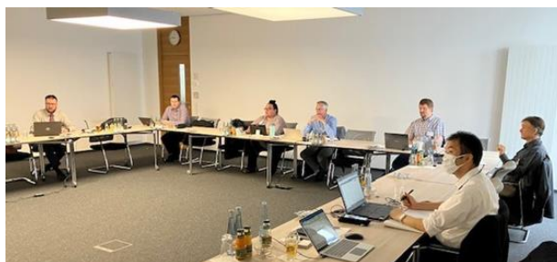
ISO/TC118 国際会議（対面会議）の様子